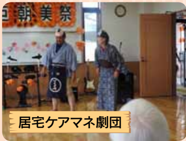
居宅ケアマネ劇団