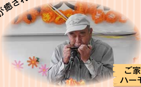
ご家族による ハーモニカ演奏