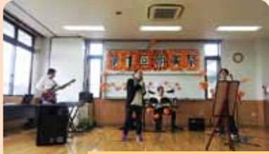
「The Big Mouth」