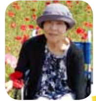
題字 門田 和子