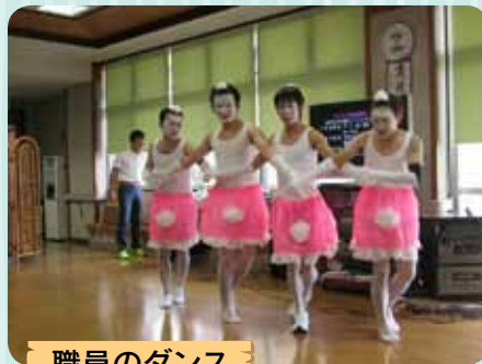
職員のダンス 「白鳥の湖」