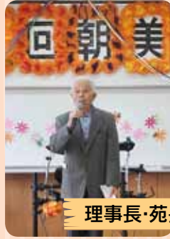
理事長・苑長による挨拶